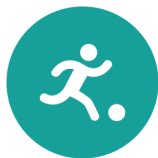
Spel en beweging/ bewegingsonderwijs